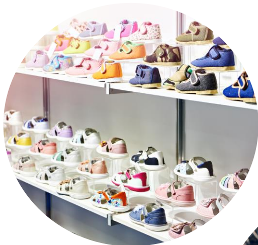
Колев & Колев