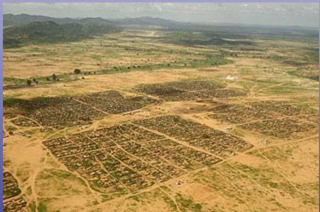
Бежански лагер в Дарфур, Судан.

Към средата на 2013 г. общият брой хора, попадащи в мерките на ВКБООН е 38,7 милиона .