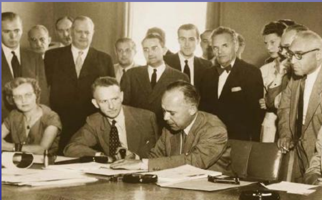
Подписване на бежанската конвенция - 28 юли 1951 г.