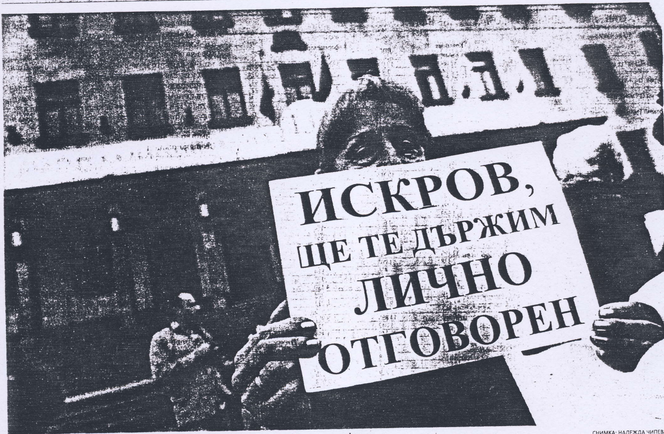
В следствие на действията ѝ около банковата криза управлението в БНБ силно се разклати