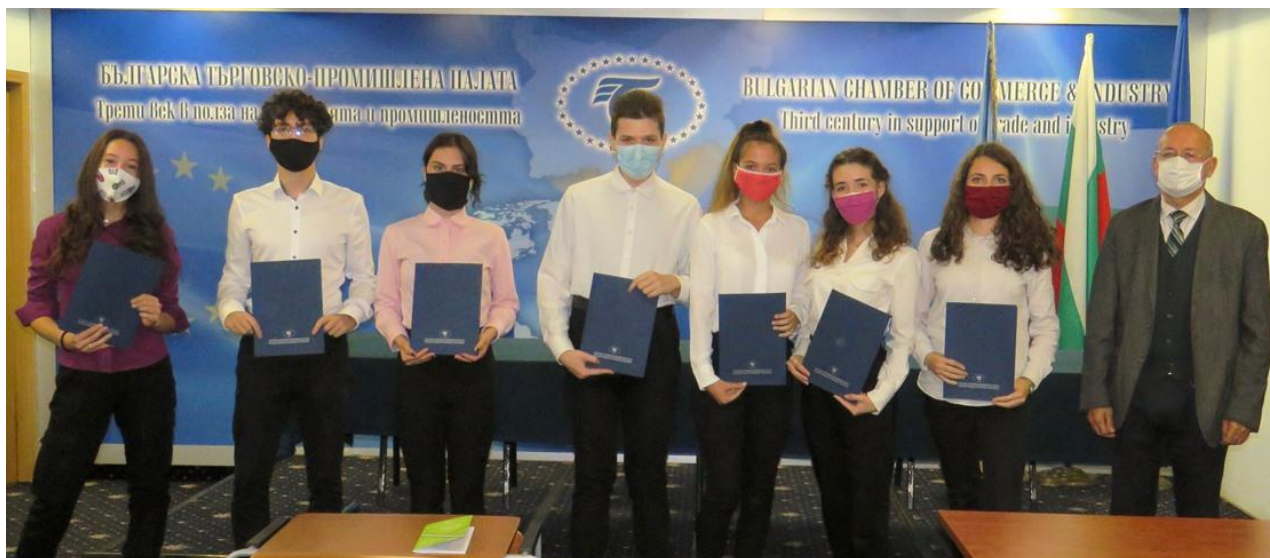
Председателят на БТПП връчи грамоти и награди най-добрите есета