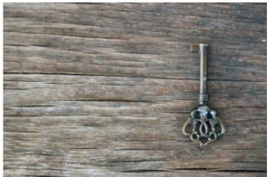
Circular Economy Toolbox