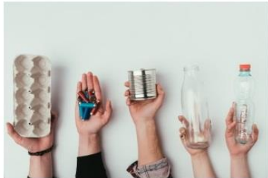
Extended Producer Responsibility

Платформата е достъпна на адрес http://danube-goes-circular.eu/ и съдържа следните раздели: