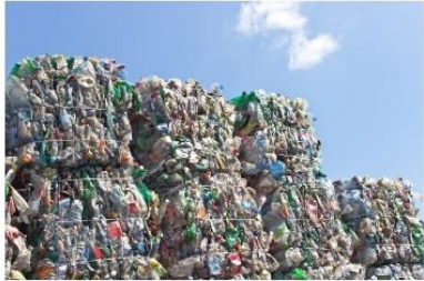
Market Place for Materials for Reuse

Discover our circular economy platform and let's make the world a more circular place!