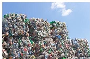
Market Place for Materials for Reuse

Discover our circular economy platform and let's make the world a more circular place!