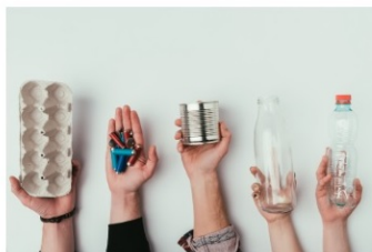
Extended Producer Responsibility

Платформата е достъпна на http://danube-goes-circular.eu/ и съдържа следните четири секции: