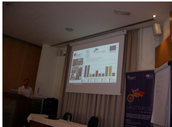
Пета международна проектна среща.