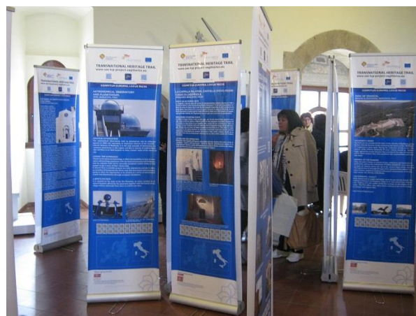
Изложба на "Пътуващия музей"