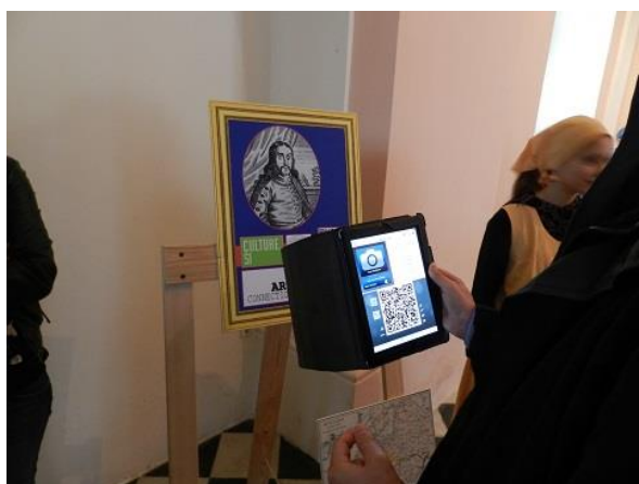
Шесто учебно посещение - игра "Последен заговор"

НАЧАЛО НА ПРЕДПРИЕМАЧЕСТВОТО В ОБЛАСТТА НА КУЛТУРНОТО НАСЛЕДСТВО НА (ГЛОБАЛНО) МЕСТНО НИВО: СТРАТЕГИЯ И ИНСТРУМЕНТИ ЗА ИНТЕГРАЦИЯ, ОХРАНА НА ОБЕКТИ, МОБИЛИЗИРАНЕ НА КУЛТУРНИТЕ ЦЕННОСТИ, РАЗПРАСТРАНЯВАНЕ НА ОПИТ