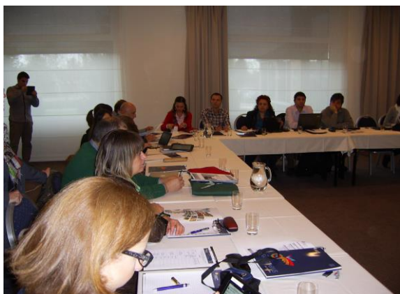
Пета международна проектна среща.

Международната игра ще се състои от приложения с информация от всички партньори. Съветът за контрол на качеството е убеден, че всички изходящи данни трябва да осигуряват минимални стандарти за качество. Приложенията трябва да водят до обектите по такъв начин, че с помощта на сканирани изображения да достигнем до зелените места на Пътуващия музей. Предназначението на музея е, да поддържа мотивацията на туристите за посещение, когато се намират на съответното място или дистанцирано да привлече публика.