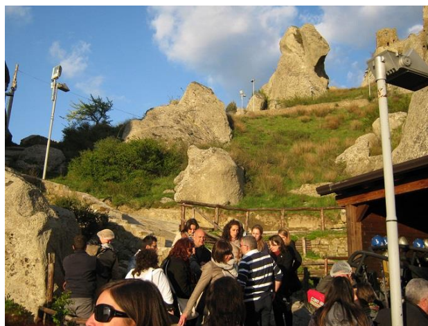
Кастелмецано в Луканските Доломити