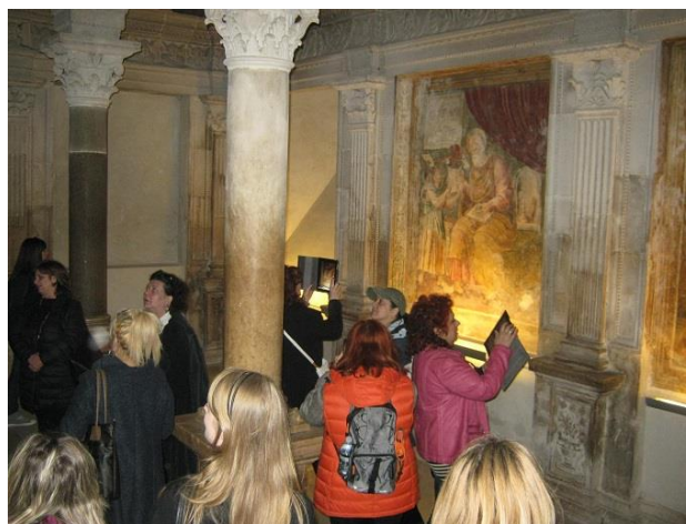
Посещение на катедралта Санта Мария Асунта и Сан Канио в градчето Асеренца

Четвъртия дан изцяло беше посветен на учебните посещения. Посетихме три места: градчето Асеренца с катедралата Санта Мария Асунта и Сан Канио, градчето Пиетрагала с каменните сгради Палменти както и живописното селце Каstellмецано и Пиетрапертоса в сърцето на Луканските Доломити.