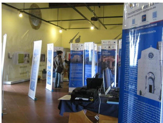
Изложба на плакати от "Пътуващия музей"

Всички проектни партньори, които участвахме в конференцията, с помощта на таблети (купени в рамките на проекта), можахме да се убедим в работата на Пътуващия музей. С помощта на iPod-и прочетохме кратки истории и информационни съобщения на QR кодове.