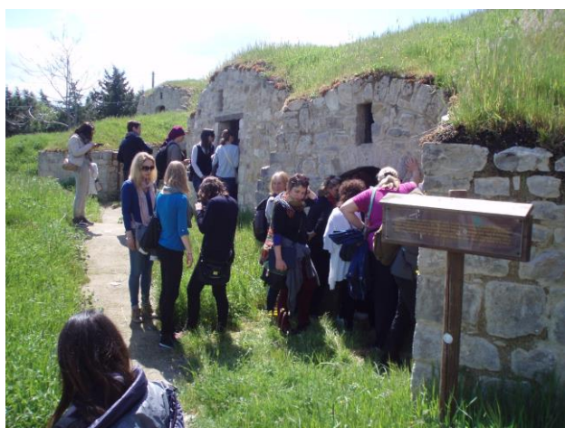
Посещение на каменните сгради за винарство Палменти.

Първо разгледахме знаменитата катедрала Санта Мария Асунта и Сан Канио. Тя се намира в центъра на градчето Асеранца и е основана на вече съществуваща палео-християнска църква, която е била изградена върху римски основи "Еколе Ахерунтино". Нейното начало датира в 1080 година, времето на владиката Арнандо. В катедралата се вижда влиянието на няколко стила от нормандско-романски стил, в нея се намира знаменитата мраморна статуя на Юлиан Вероотстъпник, а на фасадата има известно готско влияние. Има кораб и два странични кораба с платна от 16. век и крипта от 1524 г.. В днешния си вид катедралата е била изградена от знатното семейство Фернило-Балса през 1524 г. В южна Италия тя е изключителен пример на клонийска римска църква. В катедралата се е намирало седалището на много влиятелна епископия, която е владяла града и околността. Важна личност в катедралата е бил епископ Бартоломео Пригнано, известен като папа Урбан VI, първият италиански папа след преместването на корията от Рим в Авињон.