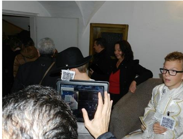
Игра "Последен заговор"

За съжаление през деня времето беше лошо, затова вторият обект ландшафтен парк "Рибниците на Раче" разгледахме само от автобуса.