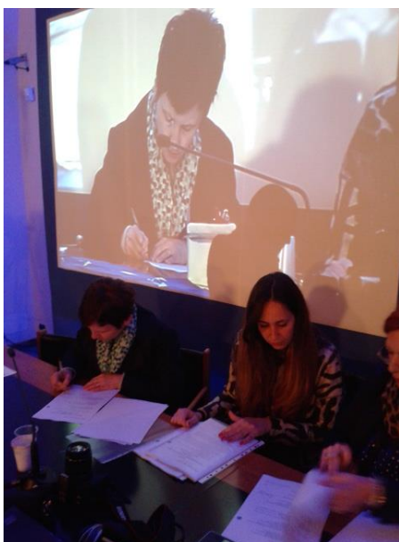
Учредяване на неформална организация Sagittarius

Неформалната организация ще бъде със седалище при Общността на общините Синело, Вия Италия № 54, Гуилми в Италия. Ще бъде учредена е в съответствие с италианското законодателство.