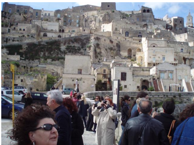
Разглеждане на древното градче Матера

световното културно и природно наследство на ЮНЕСКО. Няколко по-малки пещери са грижливо обновени и сега служат като музеи. Обновените сгради служат също за пансиони, малки предприятия и малки хотели.