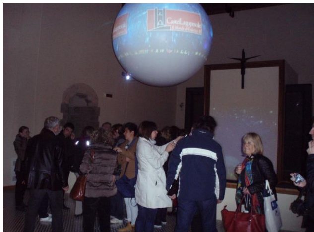
Музей в двореца Лагопесоле

Втория ден на международната конференция през следобедната почивка разгледахме музея на двореца Лагопесоле, в чийто помещения се провеждаше конференцията.