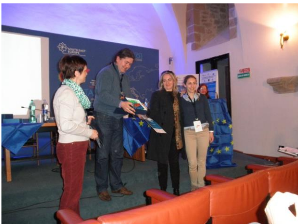
Връчване на награди за пилотни проекти Sagittarius

Главните награди на международната конференция бяха наградите за Пилотен проект. Наградите бяха връчени в девет категории. Изброяване на категориите и наградените са представени нататък в текста: