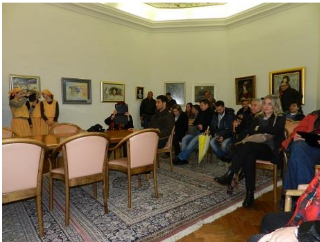
Шесто учебно посещение в двореца Раче.