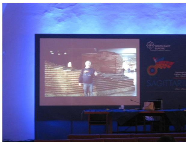
Филм за Sagittarius

Едно от централните събития в международната конференция беше прожекцията на 15 минутен филм за проекта Sagittarius. Филмът беше подготвен от партньорите Българска