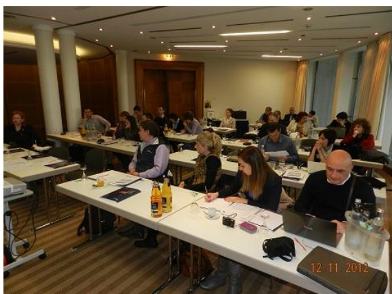
Събрание на проектния съвет

Следва финансов преглед на проекта. След предоставения трети междинен доклад водещият партньор отново обърна внимание ограниченото черпене на средства, изоставяме най-малко с 50% при общото използване на наличните средства. Затова призова всички проектни партньори да ускорят проектните дейности и по този начин да повишат използването на средствата. Финансовият водач на проекта наблегна на поправките при 3. междинен доклад. Препоръча по-голямо внимание при попълването на партньорските доклади, където се появяват малки грешки, което предизвиква отлагане на връщането на финансовите средства и спиране на финансирането.