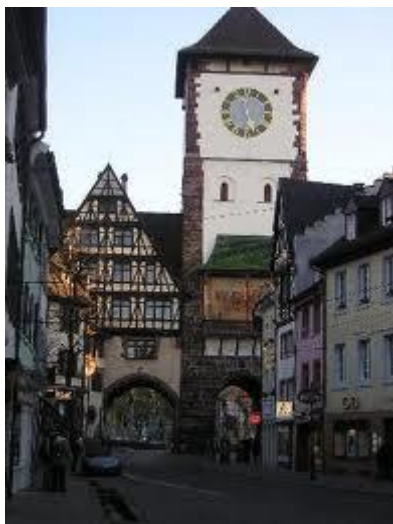
Фрайбург – стария град

НАЧАЛО НА ПРЕДПРИЕМАЧЕСТВОТО В ОБЛАСТТА НА КУЛТУРНОТО НАСЛЕДСТВО НА (ГЛОБАЛНО) ЛОКАЛНО НИВО СТРАТЕГИЯ И ИНСТРУМЕНТИ ЗА ИНТЕГРАЦИЯ, ОХРАНА НА ОБЕКТИ, МОБИЛИЗИРАНЕ НА КУЛТУРНИТЕ ЦЕННОСТИ, РАЗПРОСТРАНЯВАНЕ НА ОПИТ