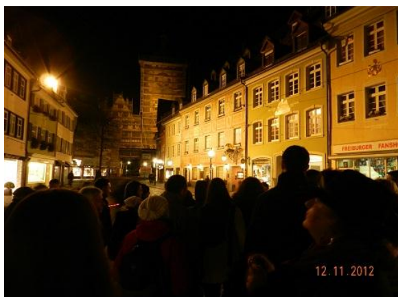
Нощен оглед на Фрайбург

Вечерната част от събранието се проведе на улиците на стария град Фрайбург. Местна туристическа водачка ни преведе по улиците на стария град, покрай важни исторически сгради. Нейния исторически разказ за Фрайбург съдържа много интерпретации и интересни истории за събития и известни личности от пъстрата история на града.