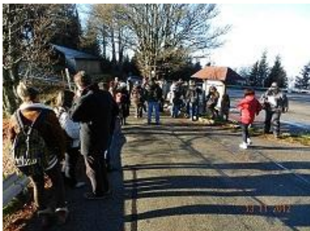
ТЕМАТИЧЕН ПЪТ 1: Шауинсланд - 1284 м

Оформянето на пътеката Белхен е било част от по-голям проект "интерпретация на културното наследство за трайно развитие на туризма". Издадени са били серия брошури, които в комбинация с номерирани места по продължение на пътеката насърчават посетителите към търсене, обръщат им внимание на специалните забележителности и им гарантират обяснение на ландшафта. Мрежата от 9 самоводени пътеки е била развита в околността на 8 селца и провинциалното градче Шьонау. Района се намира в южната част на Шварцвалд на източния склон на върха Белхен (1414 m) и в долината на реката Грьосе Висе. Всяка пътека има водеща тема - от геологията на палеозоиката, следи от последния ледников период, от историята на града до днешно време.