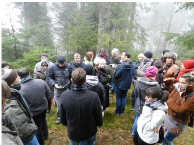
Тематична пътека 4: Калетнброн

възможност на местните общности да създават собствени смарт приложения. Посетителите получават парола, която им дава достъп до онлайн карта на общината, която обхваща всички официални туристически пътеки на някой от регионите. Определя се виртуална тематична пътека "точка на интереси", която се намира в тази област. За всяка "точка на интереси" може да се изтегли текст и снимки, както и аудио и видео записи, които са подготвени за три различни целеви групи респ. имат различно съдържание. Пътеката "Див петел" предлага ниво на съдържанието за деца (с видео), за възрастни неспециалисти и специализирано ниво.