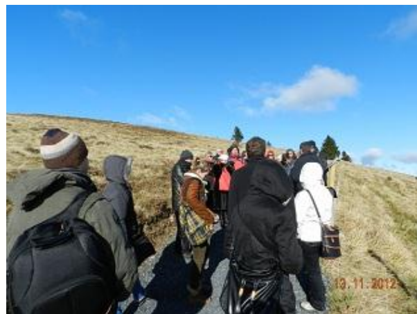
Тматична пътека 2: Белхен - 1414 м