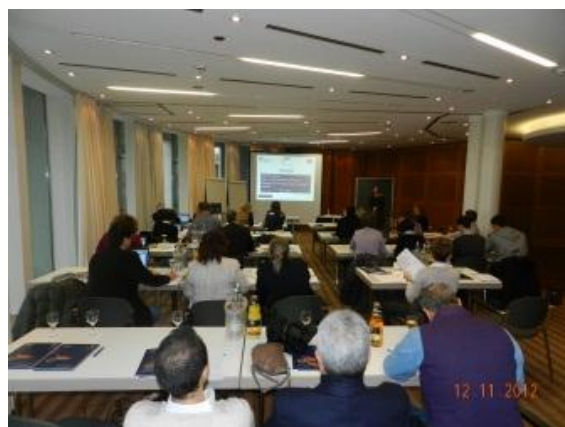
Събрание на техническия съвет